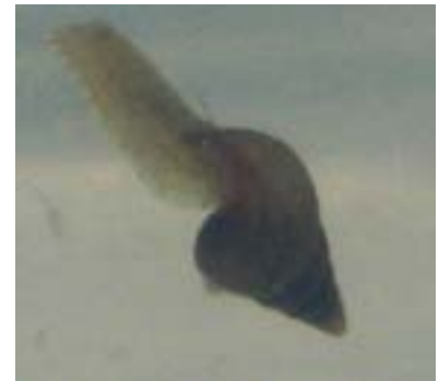
図-2 カワニナの捕食の様子

更に、カワニナを体長10mm程度のものに変更し、体長の違いが捕食に関係するのか調査を行った。こちらでもヒラタビルがカワニナを襲うまでの時間は5分ほどであった。ヒラタビルがカワニナを離すまでに3時間以上を要したことからカワニナが大きくなると捕食により時間がかかるといえる。また、どちらの観察実験においてもヒラタビルは近くにカワニナが来ると、前部の吸盤で引き寄せ積極的に捕食している様子が観察出来た。この結果から大きさに関係なくカワニナを捕食するヒラタビルは、蛭出生地においては発生を抑制する必要があるといえる。