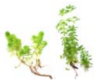
図-1 屋外と屋内のメノマンネングサ

屋外から屋内に移動したものは、葉と葉の間隔が広がったことにより丈の成長が著しく30日間で約3倍の12cm程度に伸びた。均一に繁茂していた茎部は疎らとなりムラが見られるようになった(図-2)。これ