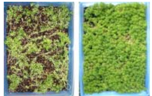
図-3 屋内から屋外実験開始時と90日後