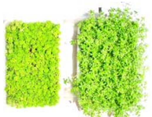
図-2 屋外から屋内実験開始時と30日後