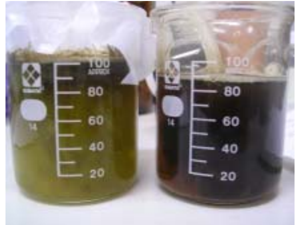
図-1 暗室実験（左：曝気なし，右：曝気あり）

アオミドロとは、車軸藻綱ホシミドロ目アオミドロ属に分類される細い糸状の緑藻類の総称である。様々な淡水にごく普通に見られ、ビオトープ構築の際には必ずと言っていいほど確認される。ラムサール条約において、湿地に対して侵的になりうる生物として取り上げられている程、繁殖力が強い。通常日本では春先から夏にかけて大繁殖し、冬季は接合胞子となって休眠状態となり、翌年春先に発芽して糸状の藻体を形成する。藻体は触るとぬるぬると滑る感触があり、水田で発生すると、水温の低下・薬剤の不均一な拡散等を招き、稲作に害を与えることが報告されている 3) 。