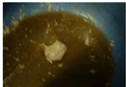
図 - 1 凝固した油